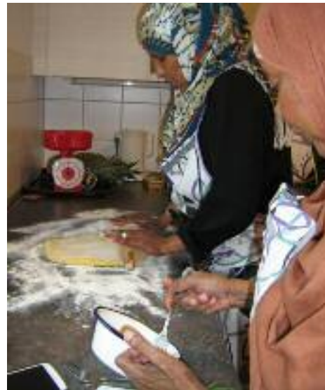
Teilnehmerinnen im Kurs „Tischlein deck dich“ beim Herstellen von Maultaschen