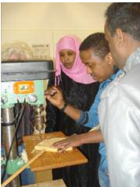
Teilnehmende der Holzwerkstatt beim gemeinsamen Arbeiten

Freitags, 9 - ca. 13 Uhr, Holzwerkstatt der Werkstatt für junge Menschen, (Thüringer Str. 22a)