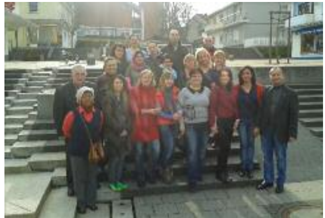
Zertifikatsübergabe am 27.02.14.

Wenn Sie Hilfe bei der Arbeit in Vereinen, Ämtern und Behörden oder als Einzelperson brauchen, wenden Sie sich bitte an das Integrationslotsenbüro ab sofort von montags bis freitags von 14:00 – 16:00 Uhr im Sozialen Stadteilladen Heuberg.