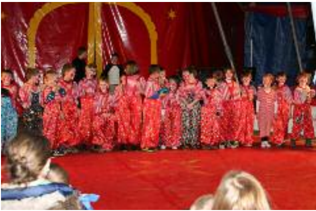
Clowns bei der Arbeit

sen stimmen, anderenfalls ist der „Tomatengag“ nicht witzig und die Diskoclowns wirken nicht lustig. Daneben bastelte, malte, las, schrieb und rechnete man im Unterricht rund ums Thema Zirkus. Jeden Tag wurden die kleinen Artisten und Artistinnen mehr gefordert, bis sie sich schließlich am Freitagmorgen den Schülern und Schülerinnen befreundeter Schulen und Kindern nahegelegener Kindergärten im Kostüm und zu geeigneter Musik sozusagen in einer Generalprobe präsentieren durften.