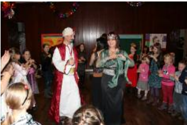
Alle hatten viel Spaß beim russischen Neujahrsfest 2014

Freitags 9.30 - 14.00 Uhr, Familienbildungsstätte, (An den Anlagen 14a)