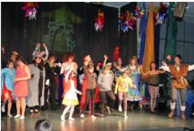
Die Darstellerinnen und Darsteller in Aktion auf der Bühne